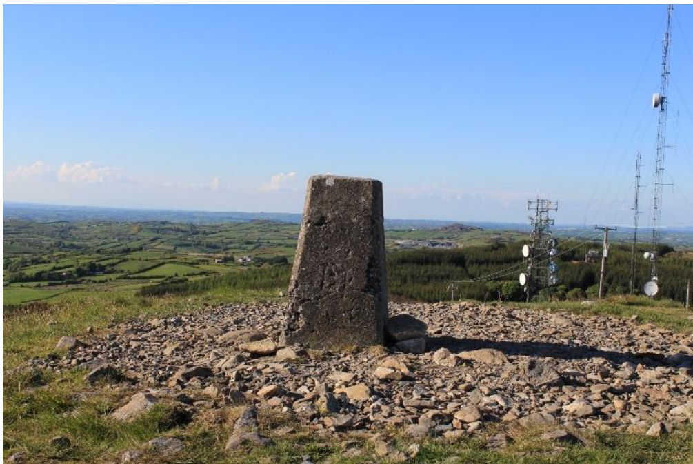
Fíor 4.4: Radhairc ó Lochán Leagha

23 Sainaitnítear Lochán Leagha sa Cavan County Development Plan 2014-2020 (Plean Forbartha Contae an Chabháin 2014-2020) (CDP an Chabháin) mar limistéar lena mbaineann ardluach tírdhreacha agus comhshaoil. Tá sé suite in oirdheisceart Chontae an Chabháin idir Coill an Chollaigh agus Dún an Rí. Clúdaíonn sé achar de thart ar 3 km ar fad faoi suas le 1 km ar leithead agus tá sé suas le 344 méadar ar airde. Cionn is gurb é an pointe is airde in oirdheisceart an Chabháin é, tá sé ina mórdhíol áitiúil spéise do thurasóirí, go háirithe mar gheall ar na radhairc fhairsinge i ngach treo. Léirítear i bhFíor 4.4 na cineálacha radhairc atá ar fáil ó Lochán Leagha.