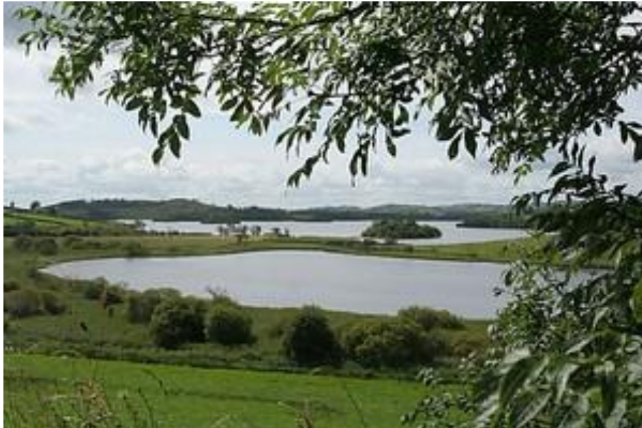
Fíor 4.2: Radharc ar Loch Mucnú